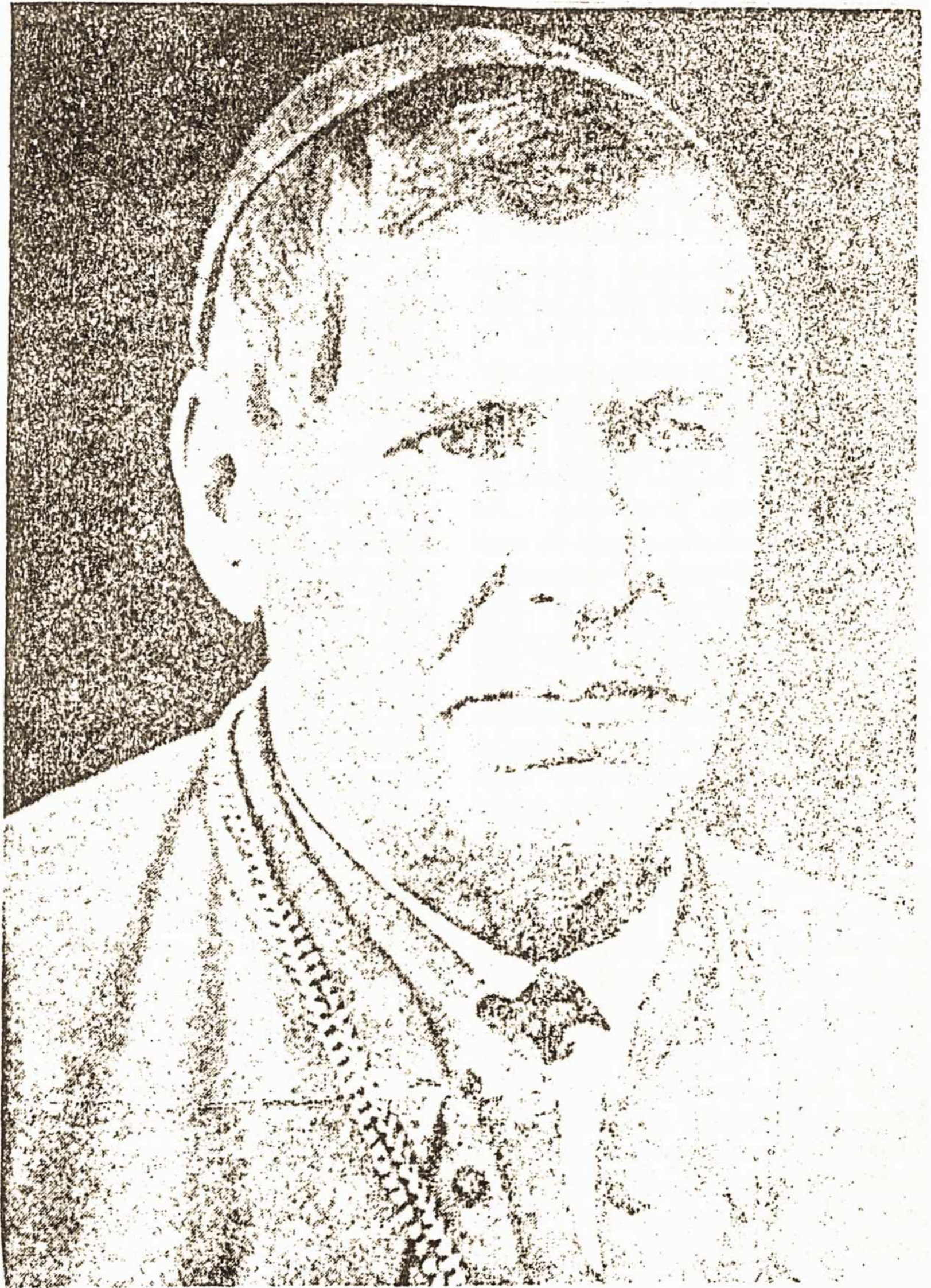
VYSKUPAS MOTIEJUS VALANČIUS (1801.II.16-1875.V.17)

Motiejus Valančius kilęs iš Žemaitijos. Gimė 1801 m. Vasario 16 d. Nasrėnų kaime, laisvų nuo baudžiavos valstiečių šeimoje. Baigęs Žemaičių Kalvarijos šešiametę mokyklą. Įstojo į Varnių kunigų seminariją. Vėliau ėjo aukštuosius teologijos mokslus Vilniaus universitete. Išsiskyrė dideliais gabumais, darbštumu ir visus patraukiančiu paprastumu. 1828 m. gegužės 16 d. Buvo įšventintas kunigu, tą pačių metų rugsėjo 1 d. apsiėmė dirbti tikybos mokytoju Moziraus apskrities mokykloje. Tik 1834m. gavo leidimą persikelti į Lietuvą. Kunigaiškis Simanas Giedraitis, žemaičių vyskupijos administratorius, perkėlė Motiejų Valančių kapelionu į Kražių gimnaziją. Per vasaros atostogas Žemaitijos apylinkėse rinko pasakas, dainas, patarles, kalbos įdomybes. 1840 m. Valančius buvo pakviestas dirbti į Vilniaus dvasinę akademiją. Gavęs teologijos mokslų doktorato laipsnį, kartu su akademija persikėlė į Peterburgą. Tais metais tokių išsilavinusių lietuvių nedaug tebuvo, todėl Motiejaus Valančiaus vardas tapo plačiai žinomas Lietuvoje ir už jos ribų. Peterburge jis neilgai gyveno ir dirbo. Drėgnas oras labai nepalankiai veikė Valančiaus sveikatą. Jis sunkiai susirgo kepenų liga. Todėl vėl grįžo į Lietuvą, bet