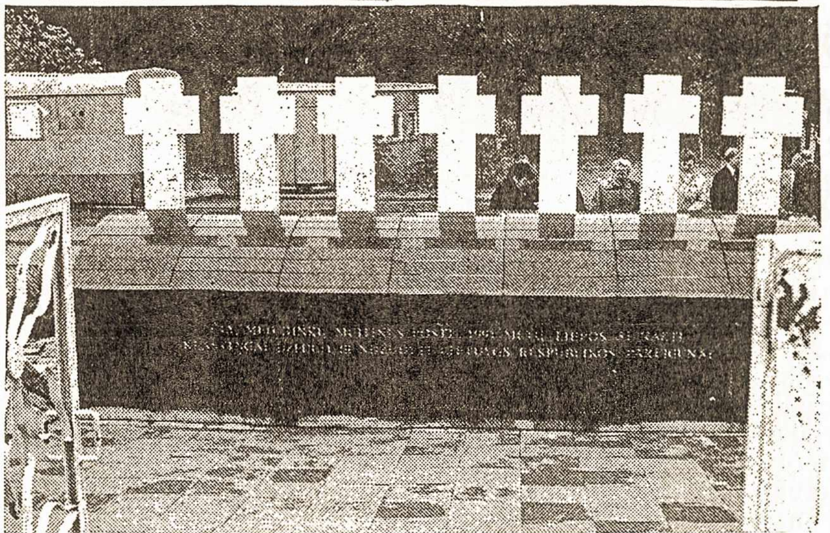
MEDININKAI: Paminklas žuvusiems pasienio pareigūnams

Šventos Onos bažnyčia Vilniuje pastatyta apie 1495-1501 metus. Remiantis 1501 m. gegužės 22 d. popiežiaus Aleksandro VI privilegija, šv. Onos bažnyčios įkūrimo data laikomi būtent šie metai. Popiežiaus privilegijoje kaip bažnyčios fundatorius minimas Lietuvos didysis kunigaikštis Aleksandras. Po 1564 m.