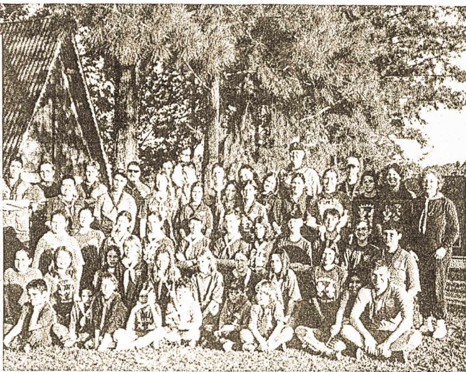
PALANGOS SKAUTŲ VIETININKIJOS 2001-mųjų metų stovyklos dalyviai Litanikoje

Savaitės bėgyje būna žinkanos sportas, žaidimai, Joninės-lauželai, pionierių balius, Lietuvos diena, susimastymo diena, giesmės, dainos, Mišios, pasiruošimas įžodžiui, talentų vakaras