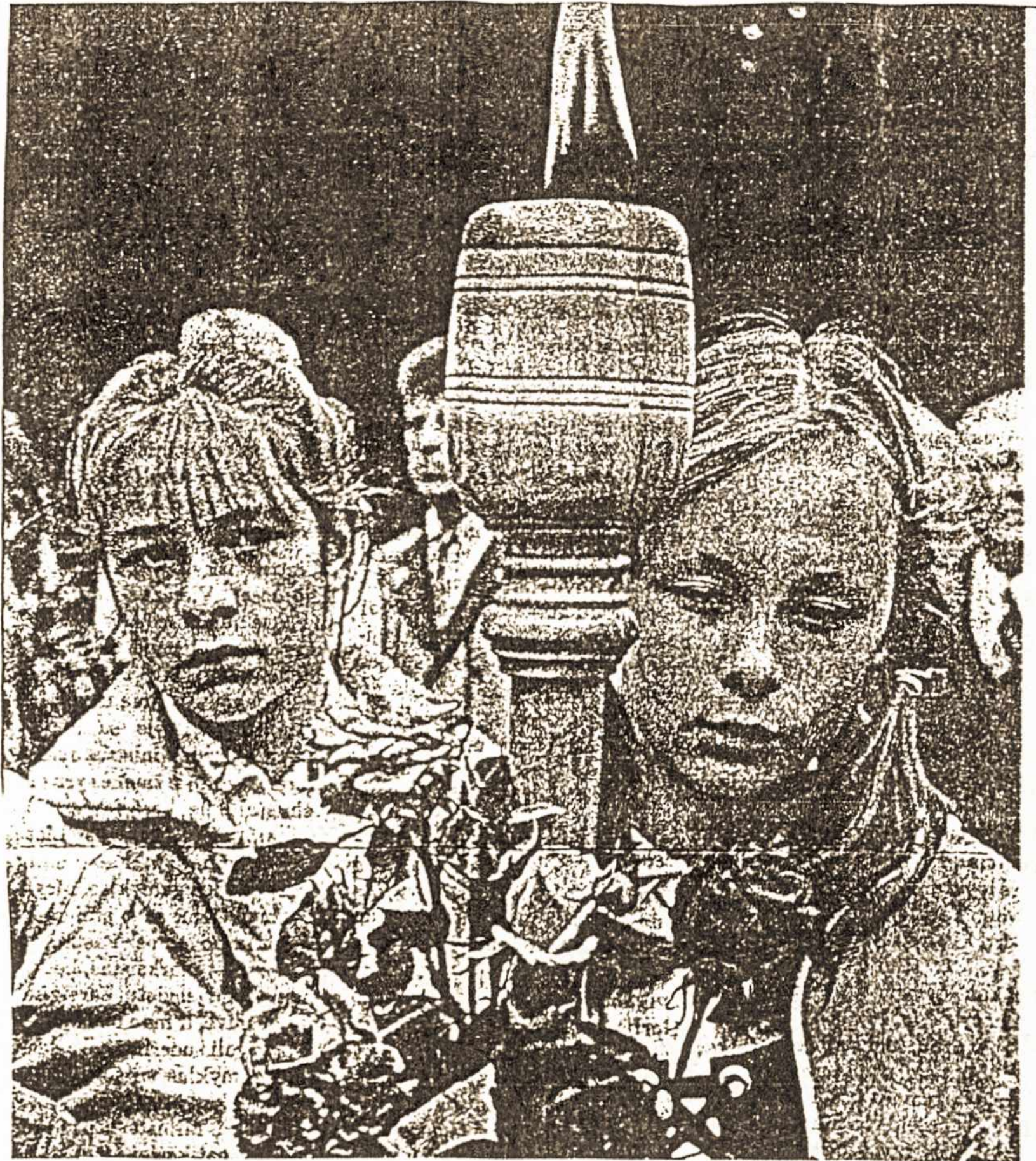
Lietuvių tautos kančių atminims neturi užgęsti

Vienok atsiprašymas gali visiškai išeiti iš vėžių, kai pareiškiamas gailėtis už de-