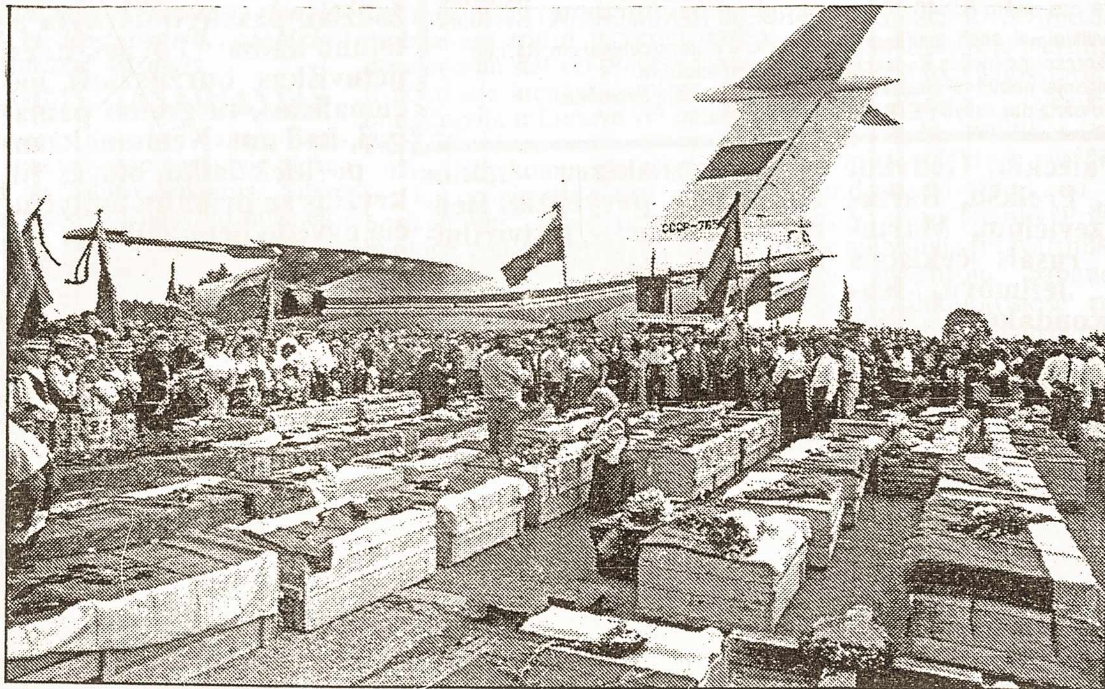
KARMELAVOS ORO UOSTAS. 1989-ųjų vasara. Tūkstančiai žmonių susirinko sutikti ir pagerbti tremtinių palaikus, parskraidintus iš Igurkos, amžinojo įšalo žemės