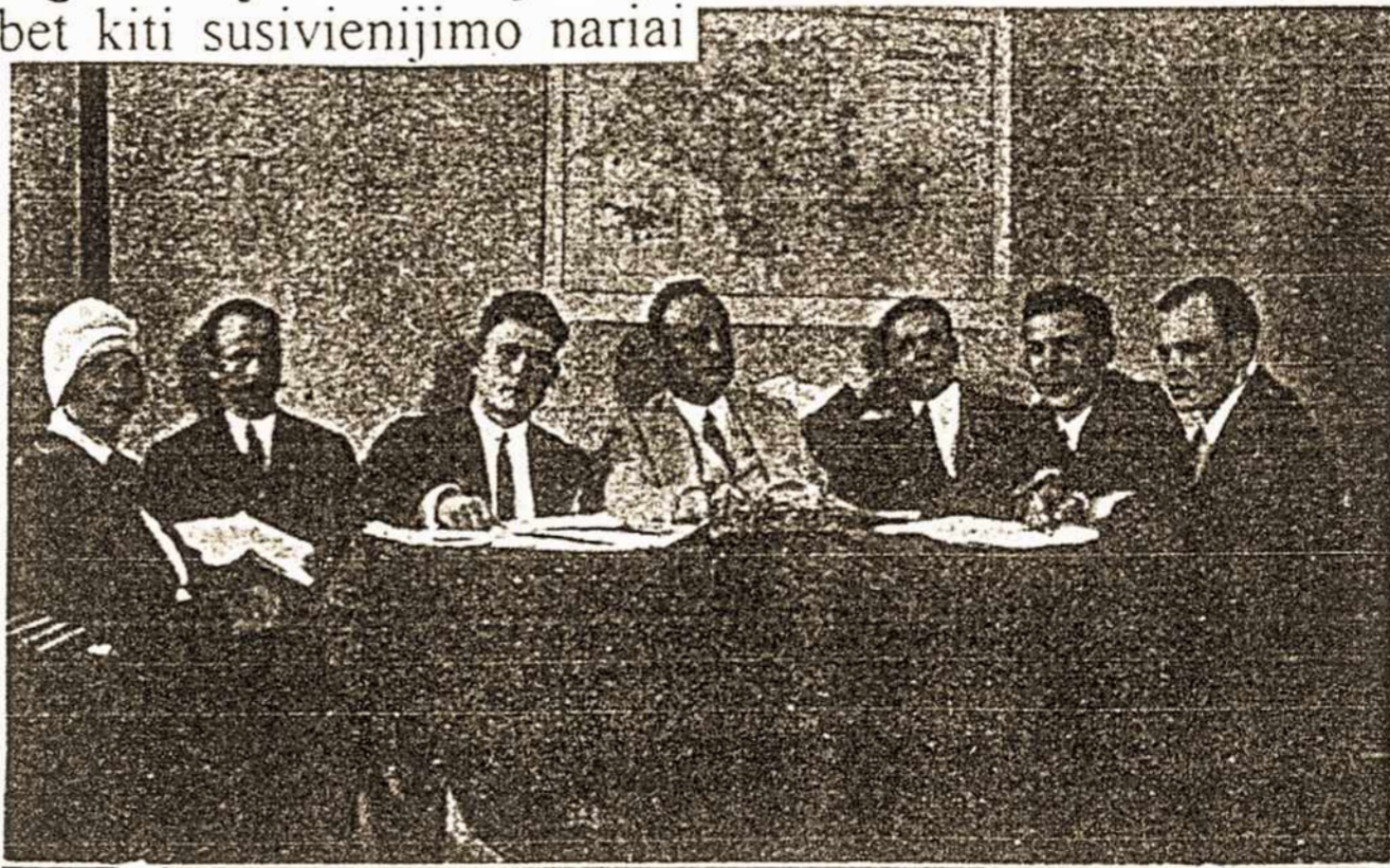
"Pietų Amerikos Lietuvio" laikraščio raštinė

Šis laikraštis niekad nebuvo už- akcentavęs kurios nors politiškos pakraipos: jis pasisakė būsiąs lie- tuvių dvasioje leidžiamas, kad pa- tarnautų lygiai visiems, kurie mo- ka ir sugeba lietuvišką žodį gerbti. o būdamas "Lietuvių Sąjungos" organu, jis stengiasi savo skiltyse gvildinti opiausius visos kolonijos reikalus.