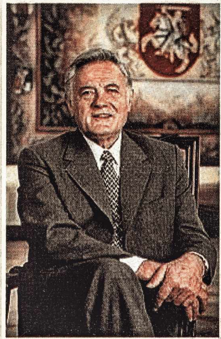
LR. Prezidentas Valdas Adamkus

visitem os sites oficiais do governo lituano: www.vrk.lt ou www.lrs.lt/rinkimai