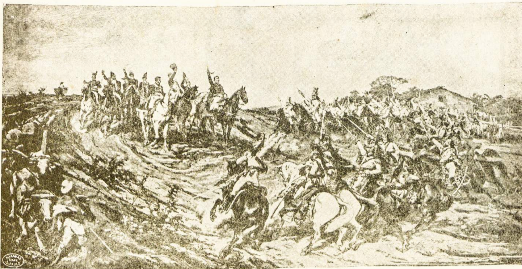
Brazilijos Nepriklausomybės paskelbimo paveikslas kuris randasi didžiuoliame São Paulo Muziejuje. Tas pats paveikslas milžiniško dydžio yra bronzoje iškalta Nekriklausomybės paminklo fasadoje Ypirangoje São Paulo.