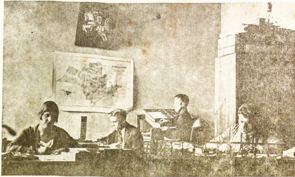
«Pietų Amerikos Lietuvio»

Pasirodymo S. Paulo mieste antro lietuviško laikraščio «Garsas», tenka sveikinti kaipo lietuviškos spaudos pletimasi bet krypinas į keistus kelius,