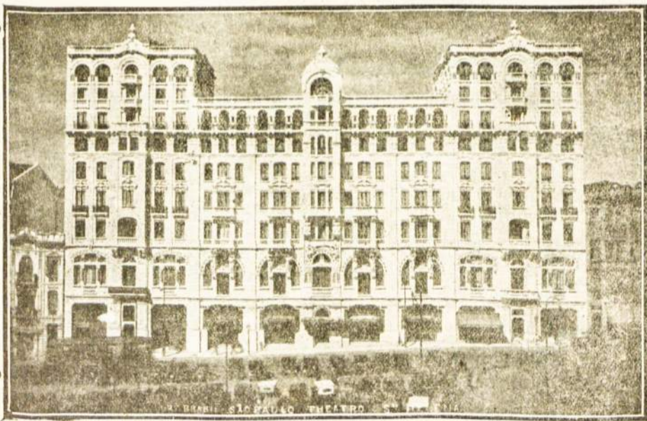
Vienas iš daugelio São Paulo m. namų.

Tautietei. Jau laikas užsiprenumeruoti 1929 metams populiaris- kiausį savaitraštį «PIETU AMERIKOS LIETUVIS»