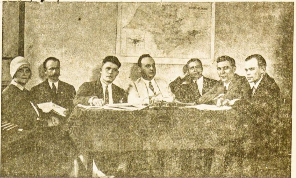
«Pietų Amerikos Lietuvio» Literatų grupė.

tovėjusi turi tris savaitraščius, kuriu kiekvienas beabejo sunkokai vystosi.