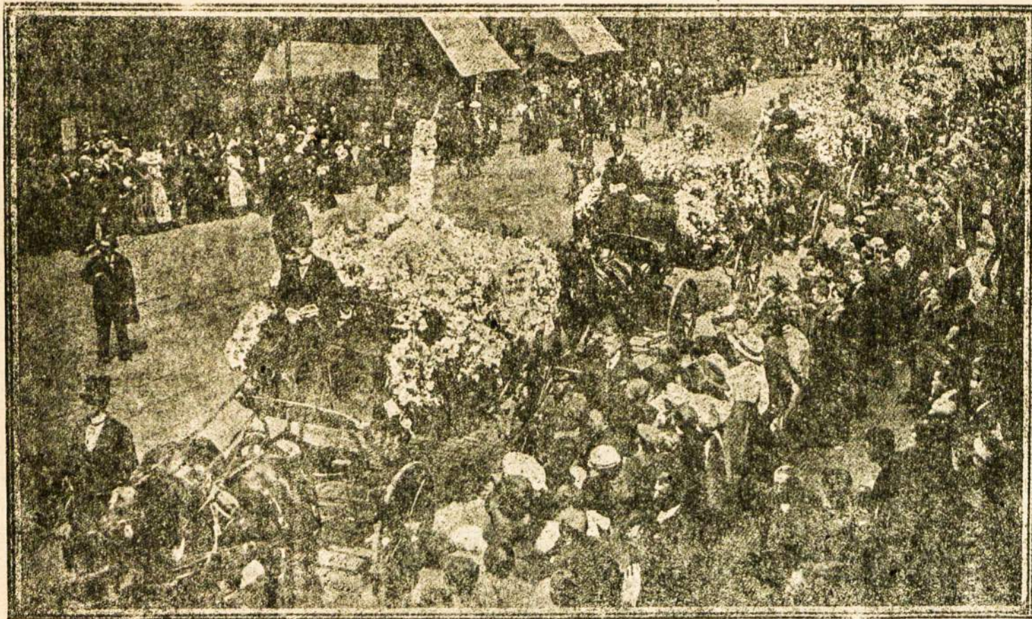
Iškilingas Londone nelaimingųjų pagerbimas. Laidotuvės auku mirusiųjų, laike didžiulės sprogusiu gazo sandeliu katastrofos. (1928 m. pabaigoje)