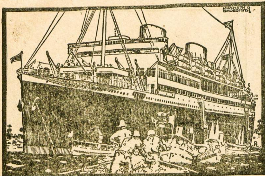
22000 tonų talpos ASTURIANA — LCANTARA 32.000 tonų talpos