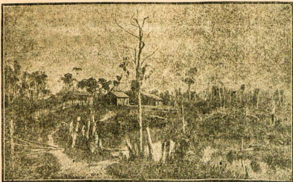
Ka tik pradėjusio kurtis kolonisto pasoda žiurint iš tolo

Rua dos Gosmoes Nr. 75. Prieš Policijos istaiga. ir Rua Duque de Caxias Nr. 2-B. Prieš nauja Sorocabano stoti.