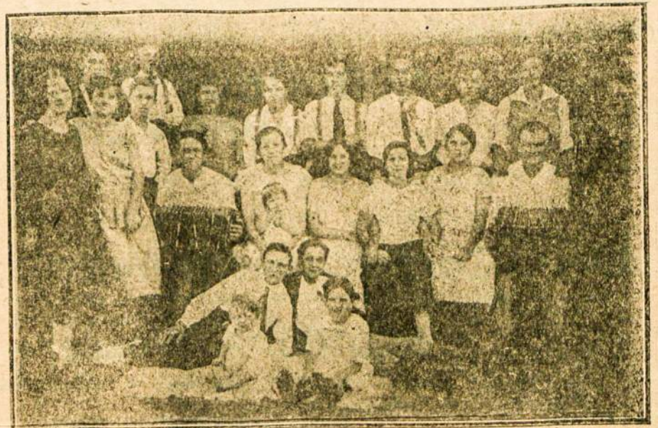
Kolonistu jaunimas šventadienio pavakary.