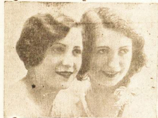
Kam fotografuotis kitur, jei čia pigiau ir geriau darome.