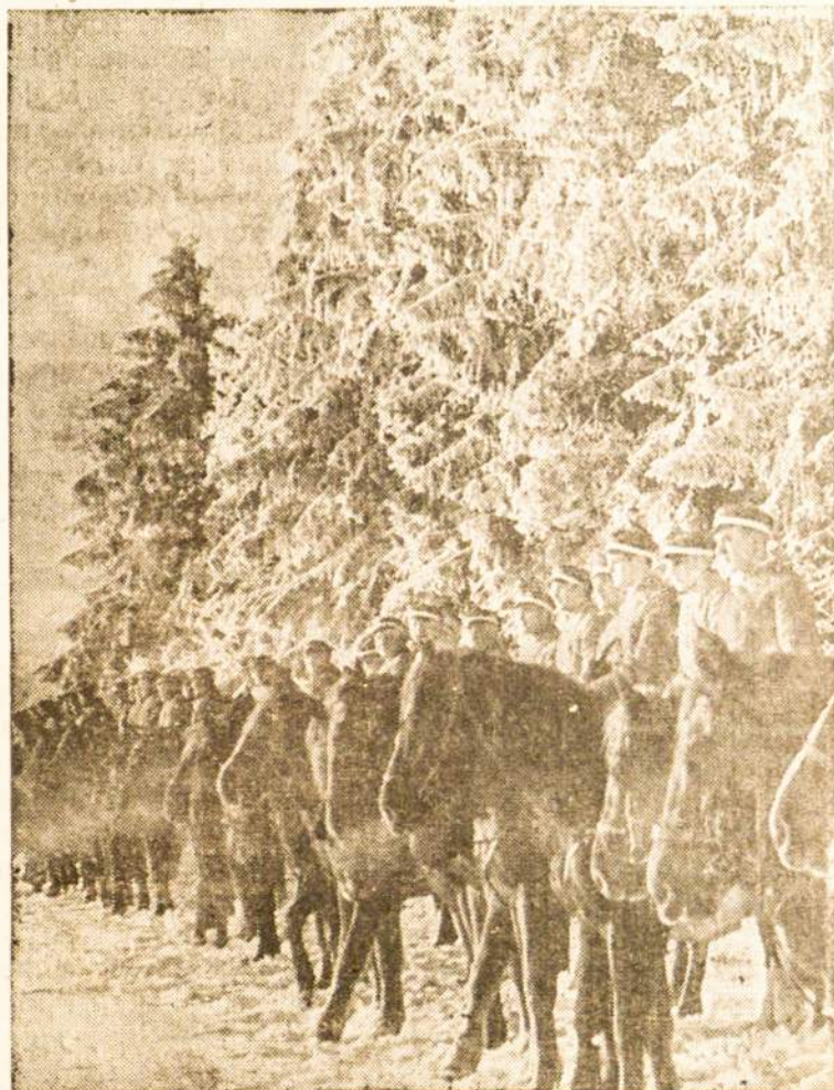
Lietuvos atsargos karininkai studentai Tėvynės sargyboje laike didžiųjų šalčių, jų žirgai apšerkšnoję.

Tose pat vestuvėse buvo ir daugiau jo draugų, su kuriais jis turėjo senesnių nesusipratimų, ir tik vakarykščiai buvo gerokai susivaidiję. Jam išėjus, jurintieji keršto pataikė progą į ten pat užpuolė ir vietoje užmušę pasišalino.