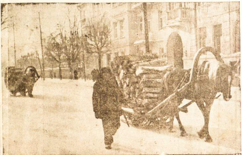
Lietuvos žiemos vargai — ūkininkas gabenasi malkas

Be eilės kitų reikmenų, del karo nepaprastai yra pasunkėjęs automobilių padangų ir kamerų gavimas. Ryšium su tuo yra kilęs sumanymas vietoje šiuos reikmenis gaminti. Yra galvojama automobilių padangų ir kamerų gamybai įsteigti net specialią įmonę. Tas klausimas yra aiškinamas.