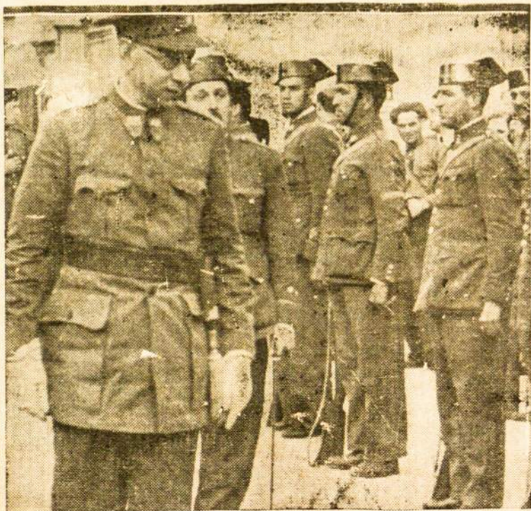
Ispanijos sukilelių vadas generolas Mola apžiūri savo kariuomenę.

Prasidėjus Ispanijoj revoliucijai Montevideo komunistinis elementas pradėjo burtis ir ruošti panašius, kaip Ispanijoj, įvykiams, bet tai matydama Urugvajaus vyriausybė šioms komunistų repeticijoms padarė galą, uždarydama jų veikimą.