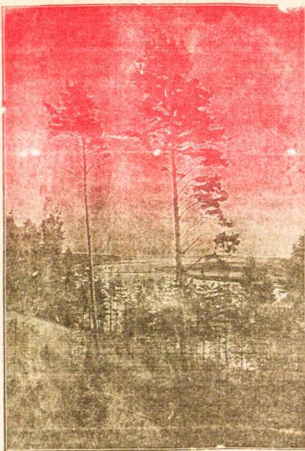
Didžiausios Lietuvos upės Nemuno žiedas ties Balbieriškiu. Pušynais krūmokšniais ir gėlėmis išdabintos viso Nemuno pakrantės.