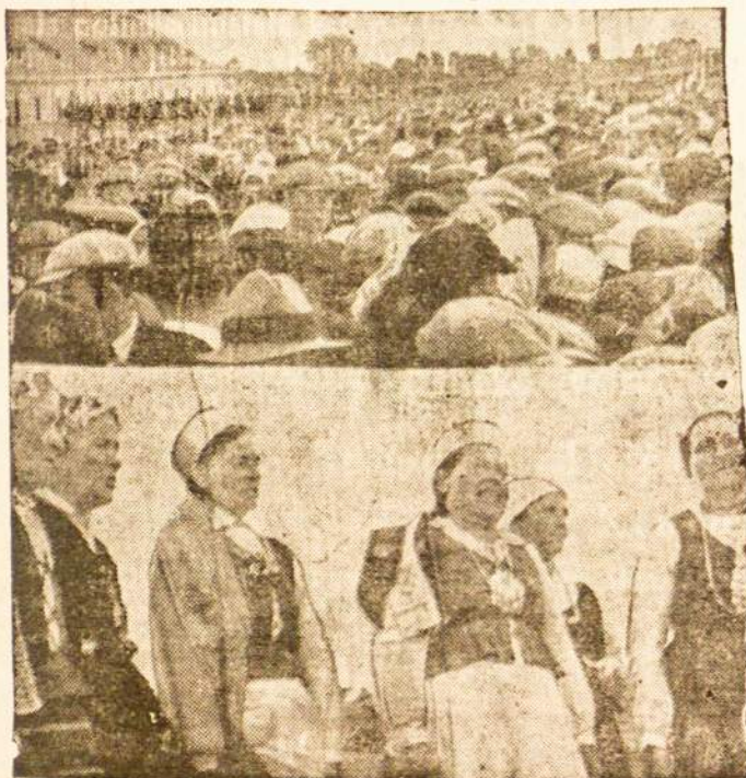
Lietuva švenčių metu

Priima kasdiena nuo 9 ryto iki 8 vakaro, sekmadieniais visą dieną Specialistė prie gydymo ir visų moterų ligų. Kalba visomis slavų kalbomis vokiškai ir upranta lietuviškai.