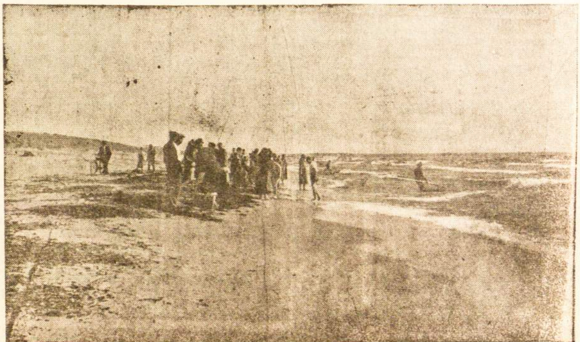
Gintaro ieškotojai Palangos pajūriais