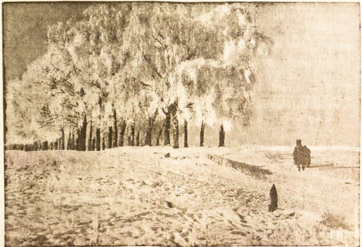
Gražioji Lietuva. Apšerkšnojė beržai vieškelyje.

— Vyr. Tribunolas paskelbė motyvuotą sprendimą, kurio iš elektros bendrovės priteista Kauno savivaldybei 80.821 litas už permokėjimus stočia 1931 metais.