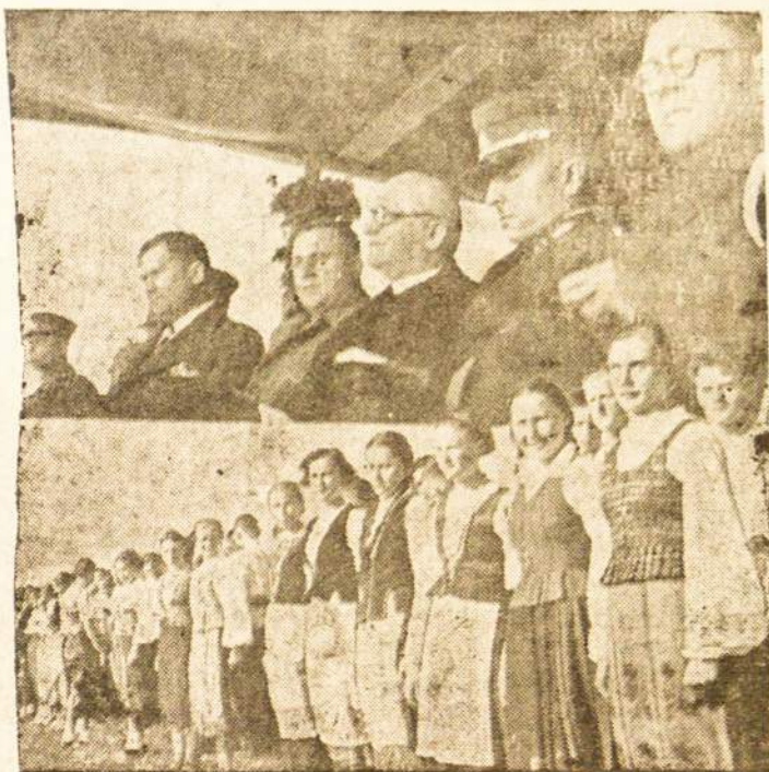
Lietuva Svenčių metu