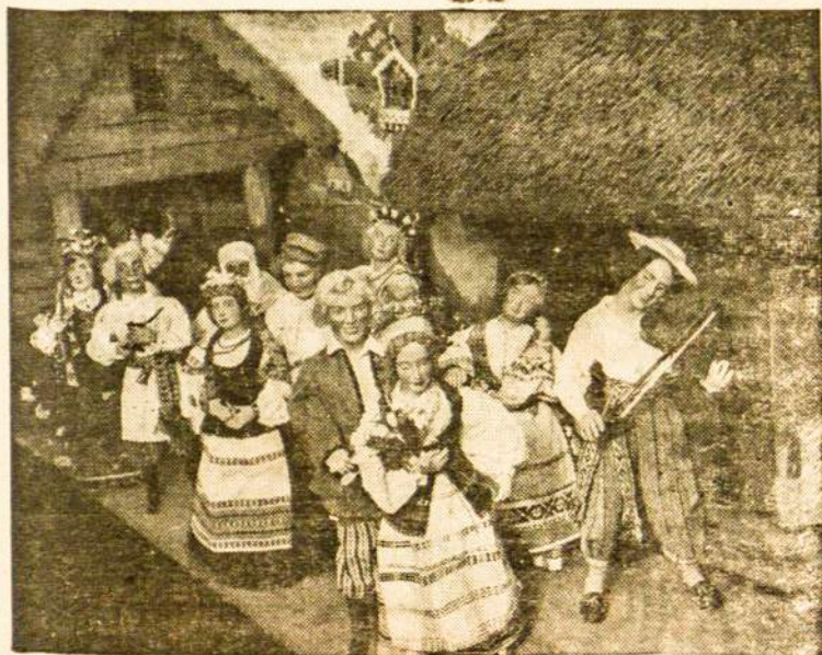
Lėlės vaidina "Lietuviškas vestuves", Kaune.