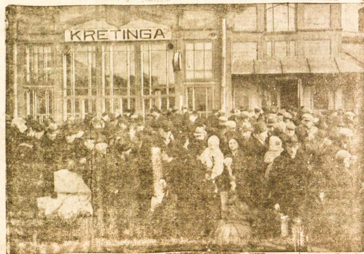
Didelis susigrūdimas Klaipėdos pabėgėlių Kretingos gelžkelio stotyje