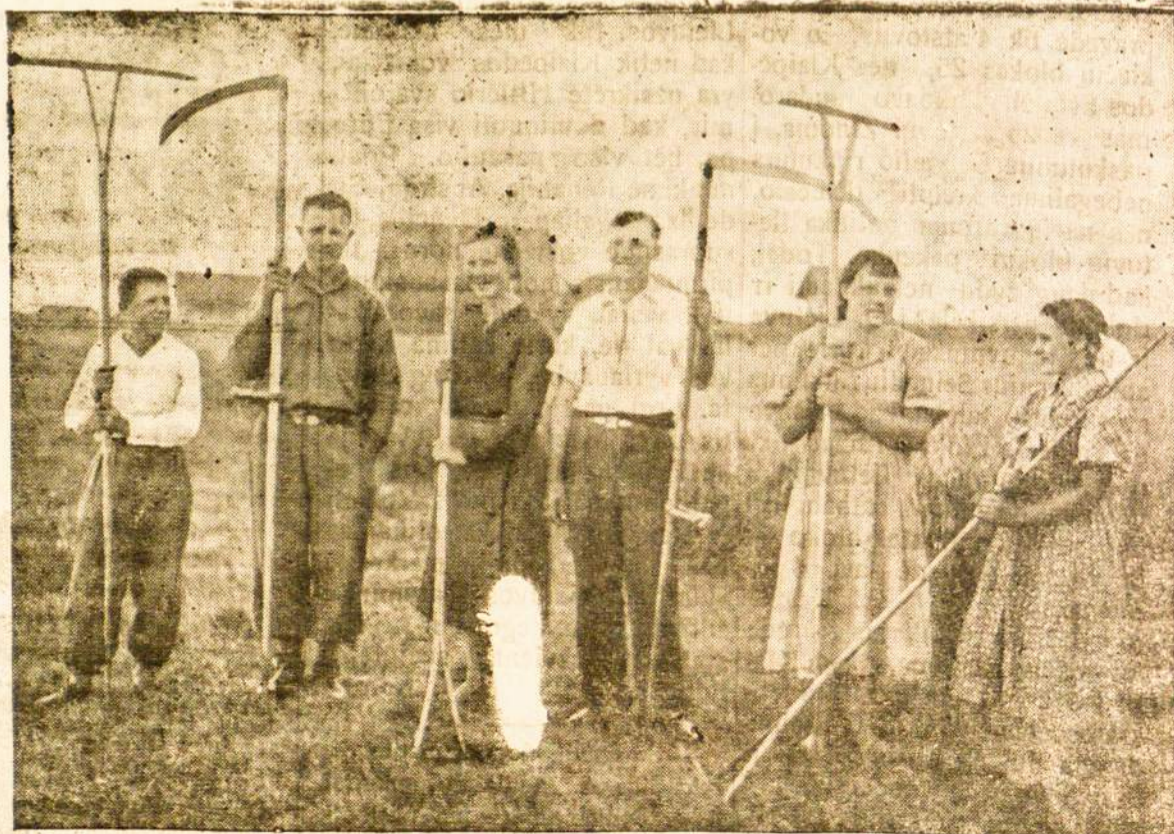
Vilniaus krašto lietuviai šienpiovėjai ir grebėjos.