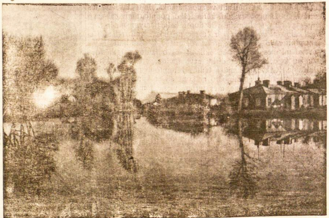
Rytmečio atspindžiai Lietuvos kariuomenės vasaros kariuomenės rajone.