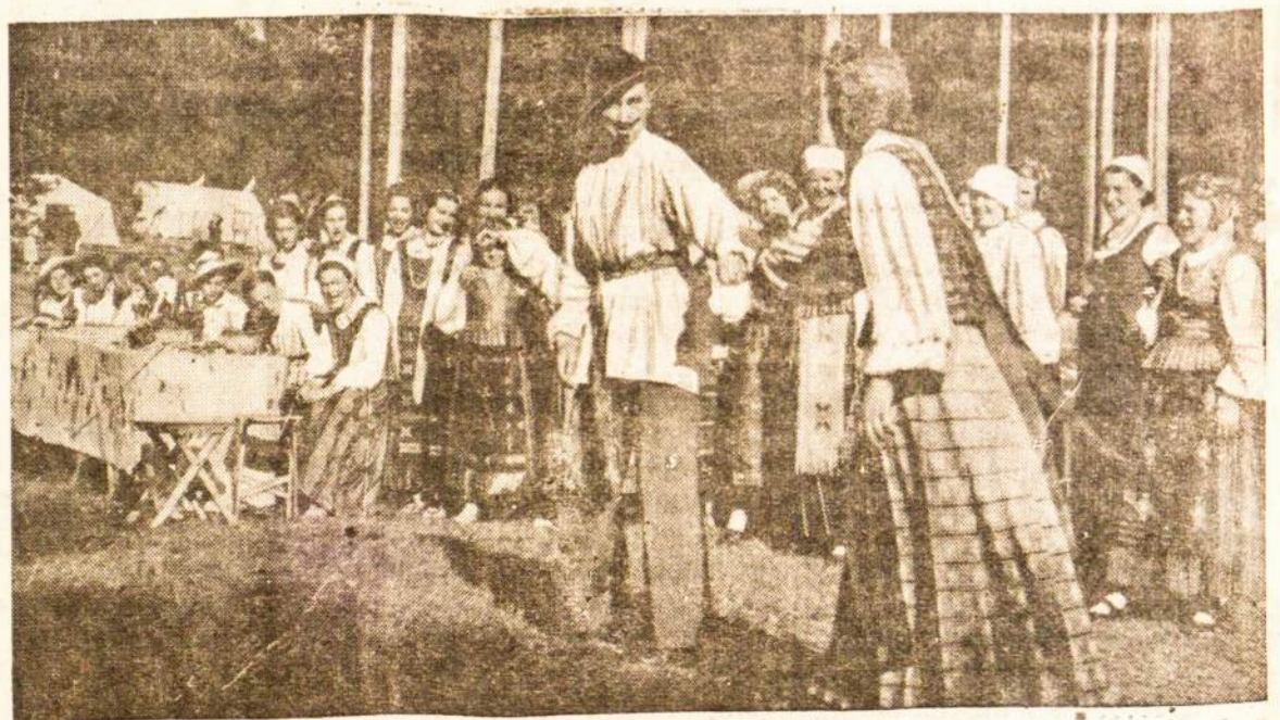
Senovės Lietuviškų vestuvių vaidinimas

Avenida Mitre 436. Avellaneda U.T. 22 = Avellaneda 7990 =