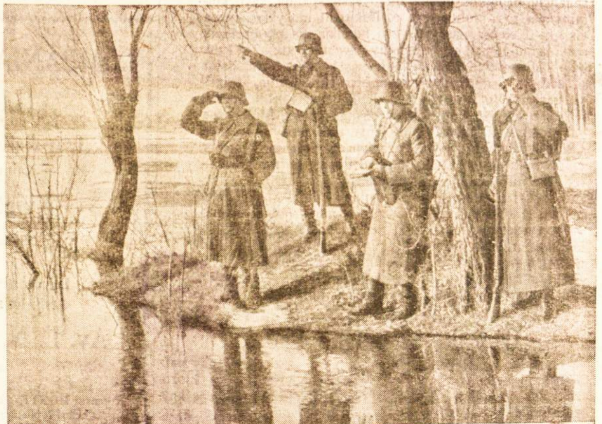
Lietuviai kariai apžiūri apylinkes

Kauno miesto savivaldybė atleido iš darbo visus viengungius inteligentus bedarbius. Iš visų atleistųjų yra apie 600 asmenų.