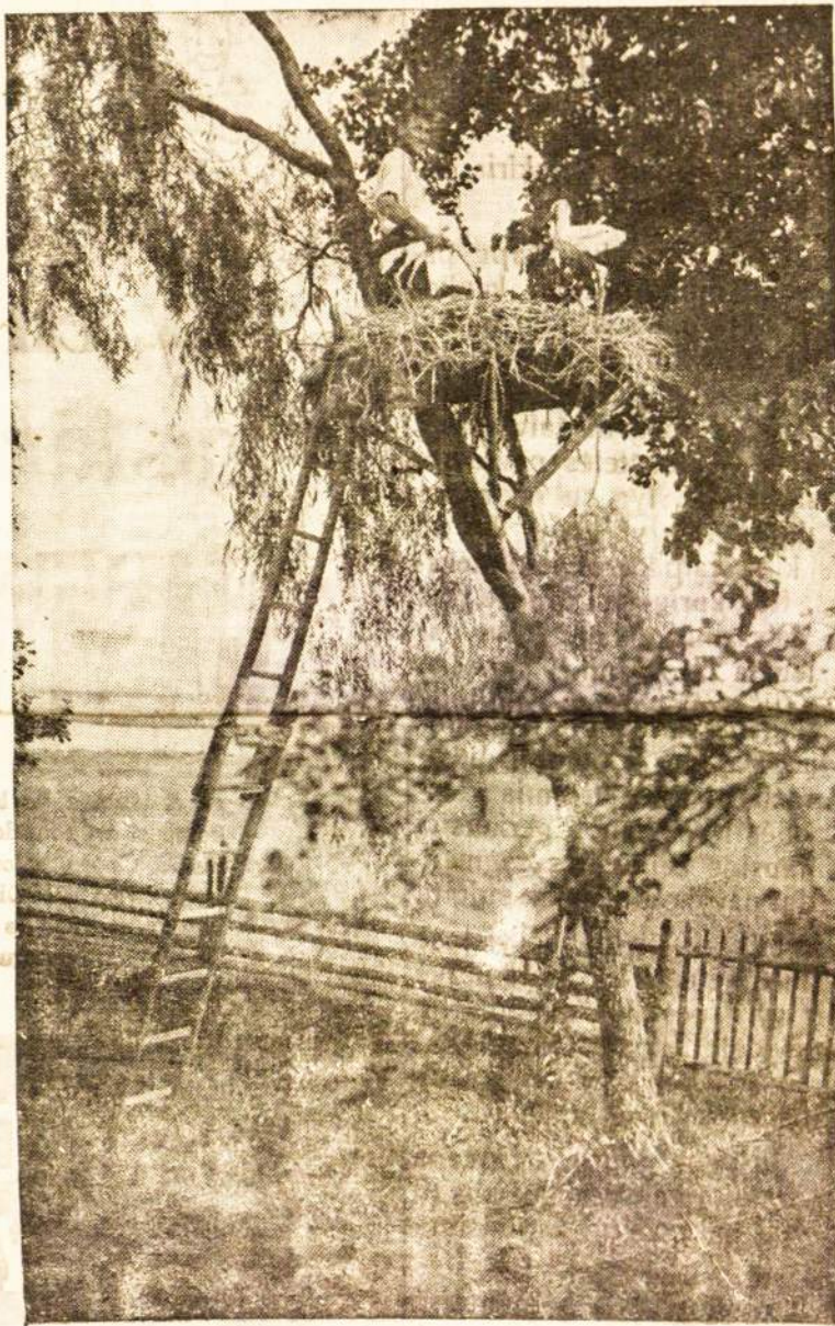
Lietuvoje. Kai pavasaris atšįla.