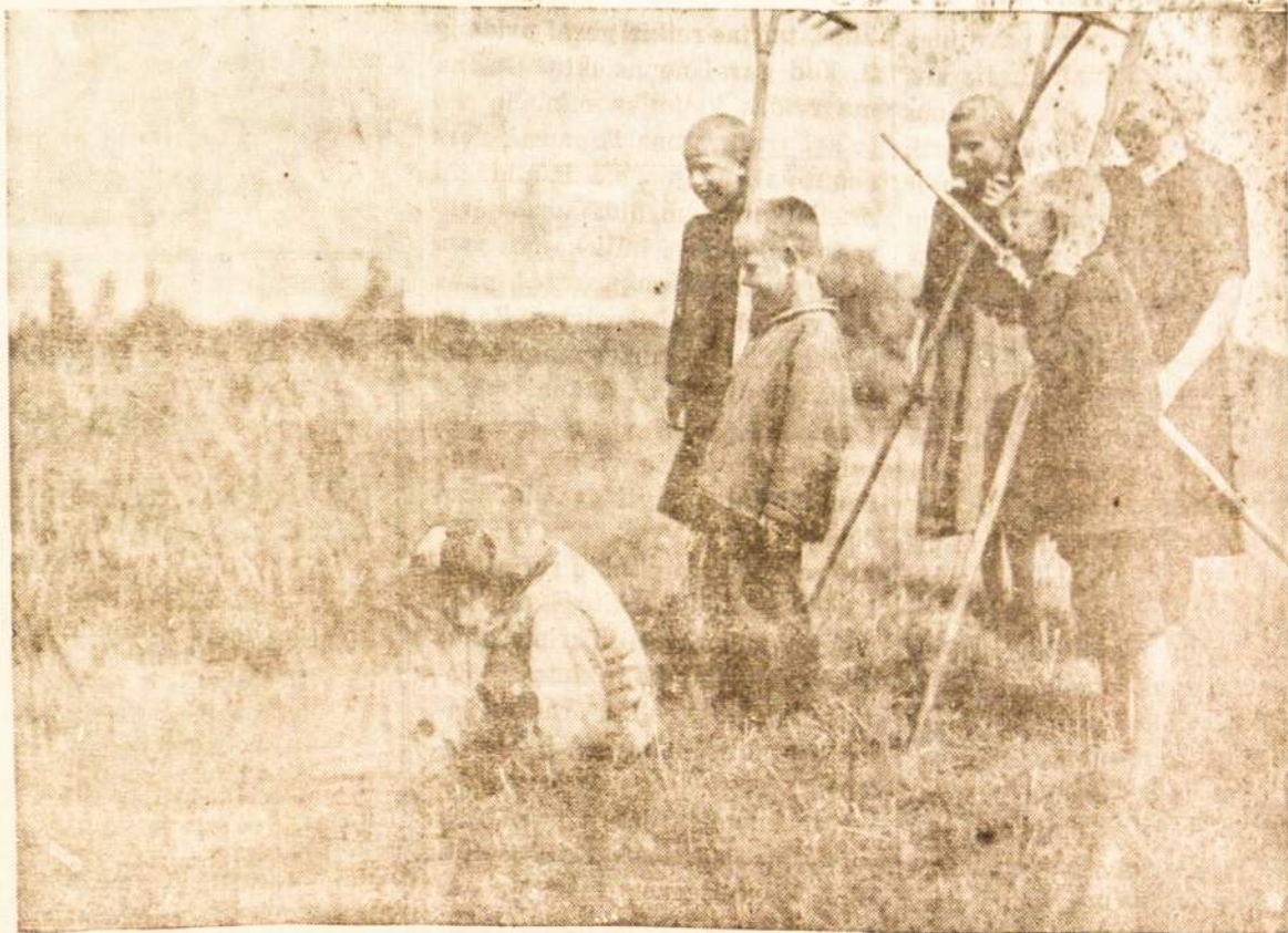
Vilniaus Krašto lietuviukai prie vasaros darbų