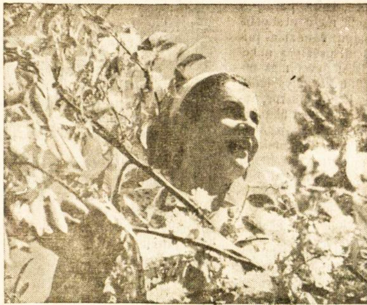
Mūsų gražioji Lietuva šypsosi vasaros žieduose, o dabar čia žiema, gi mūsų širdys pilnos tėvynės ilgesio

tės valstybes rusų žinion. Rusijai bereikia laukti tinkamo momento jas užimti. Galutinas susitarimas dar nepaskelbtas.