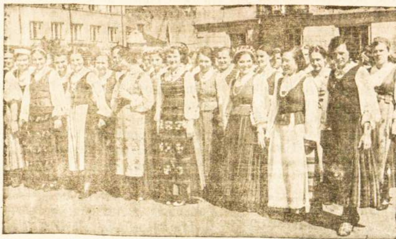
Lietuvės tautiškuose rubuose.

Visos didžiosios Europos valstybės paminėjo 25-kių me-