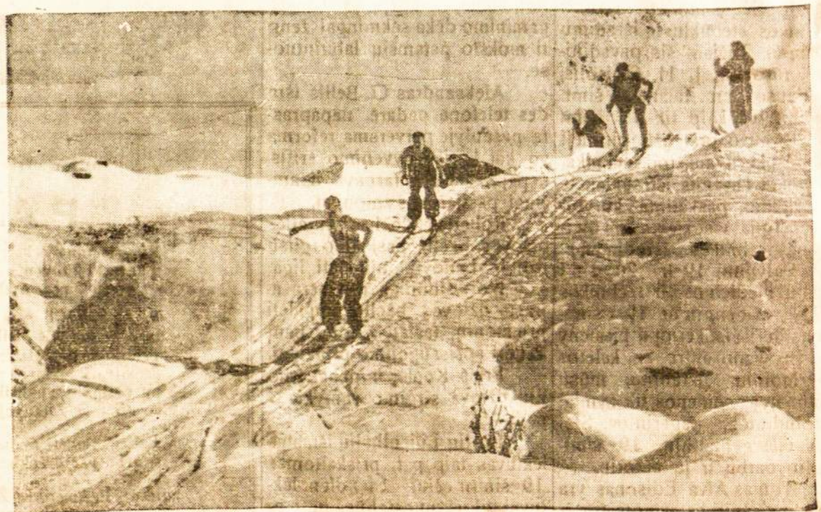
Ir Lietuvoj praktikuojamas žiemos sportas "sky"