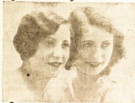
Kam fotografuotis kitur, jei čia pigiau ir geriau darome.