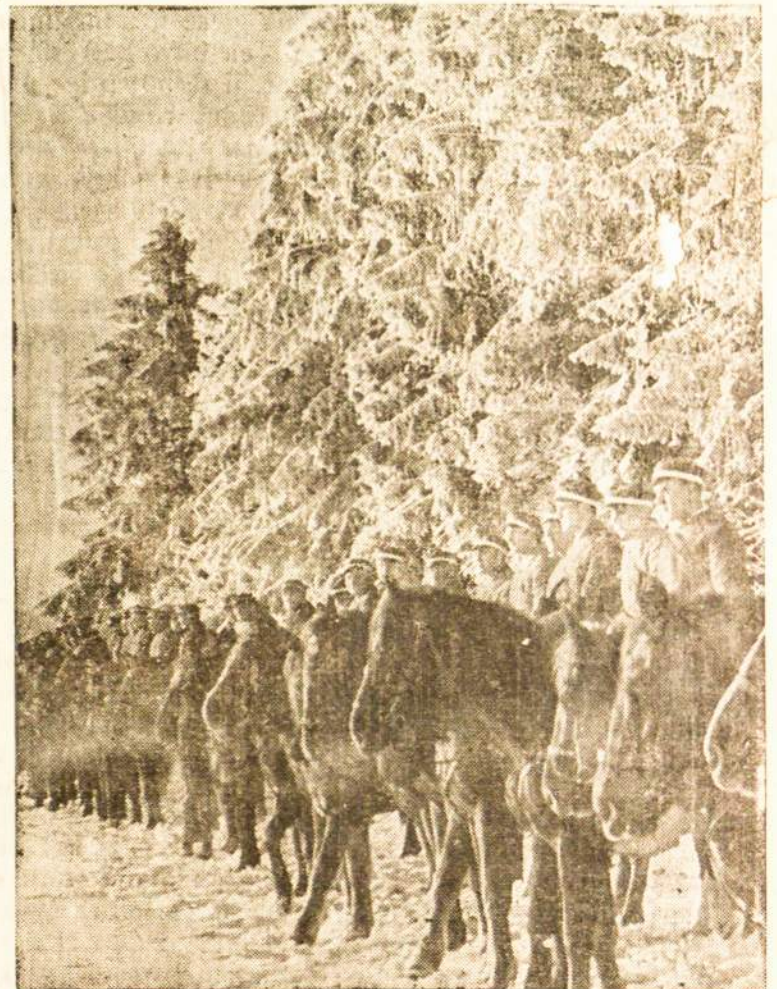
Lietuvos atsargos karininkai studentai Tėvynės sargyboje laike didžiųjų šalčių, jų žirgai apšerkšnoje.

Tose pat vestuvėse buvo ir daugiau jo draugų, su kuriais jis turėjo senesnių nesusipratimų, ir tik vakarykščiai buvo gerokai susivaidijęs. Jam išėjus, jurintieji keršto pataikė progą į ten pat užpuolė ir vietoje užmušė pasišalinę.