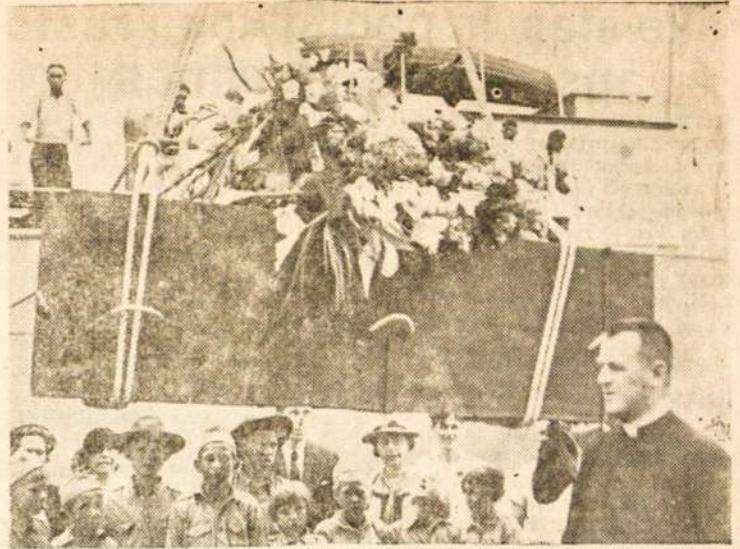
A. A. BRONIAUS STEPONAČIO KARSTO IŠNE-IMAS IŠ KAPINIŲ IR VĖJELIMAS Į LAIVA «EQUADOR».