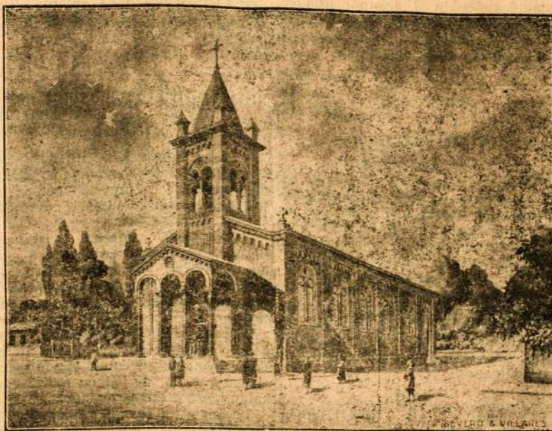
Neujos pastatytos šv. Juozapo bažnyčios vaizdas

Iš Addis-Abeba pranešama, kad ten sausio 1 d. svetimtųjų elementas užpuolė visas italų krautuves, viešbučius ir valgyklas ir sunaikino visas esančias italų prekes, kaipo kerštas už bombardavimą Raudonojo Kryžiaus.