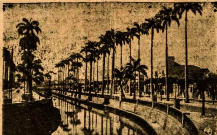
Gražiausias Rio de Janeiro kanalas — Mangue.