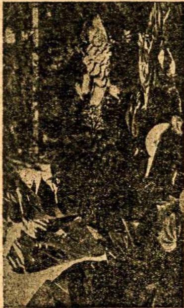
■■■■ PANANU KULTŪRA ■■■■

atgabentos ir jų šeimos veltui. Kolonizacijai bus teikiama didelė valdžios parama. Jau dabar pasiūsta vice-karaliaus žinion kolonizacijos reikalams 500 milijonų litų.