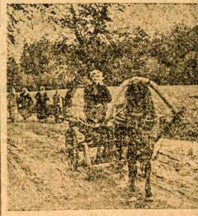
VYKSTAME Į TURGU.

Dabar nekantriai lauksim kitų tokių švenčių. Sakelė.