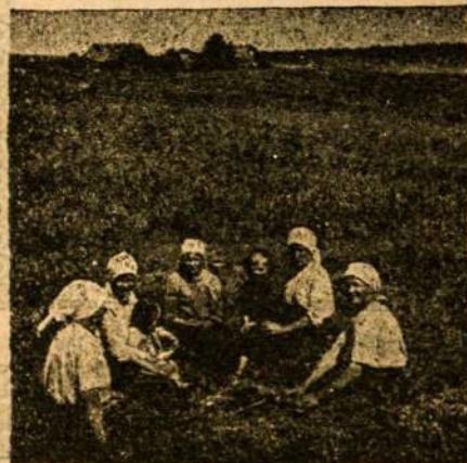
Smagu pasilsėti po sunkaus darbo.