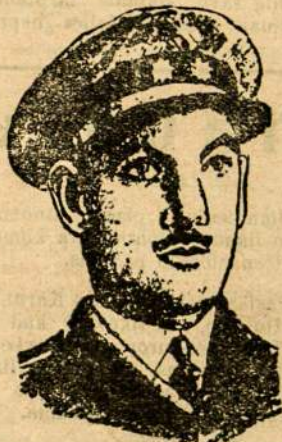
PULKININKAS YAGUE, PIRMAS ĮZENGES Į MADRIDĄ.

Rusų Karo Komisaras, p. Vorošilovas pareiškė viešai, per radijų Maskvoje, kad dabartinis pasaulio bruzdėjimas turis vienintelį siekį — Rusijos sunaikinimą. Tuotarpu Rusija nieko daugiau netrokštanti kaip tajkos ir pasaulio subolševikinimo.