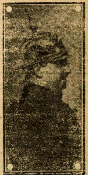
VYRIAUSIAS NACIONALISTU TU VADAS GEN. F. FRANCO