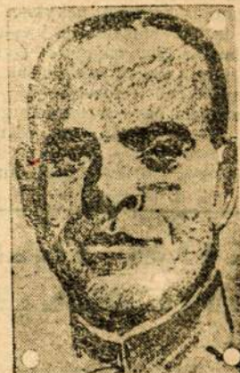
GENEROLAS VARELA, Paėmęs Toledoą.