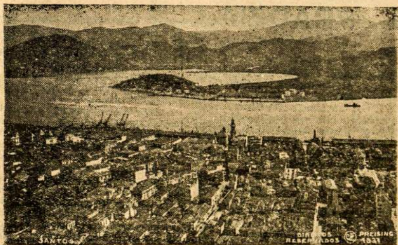
SÃO PAULO UOSTAS SANTOS, PRO KURI DAUGUMAS LIETUVIŲ PIRMA KART IZENGĖ BRAZILIJON.