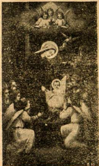
ANGELU GIESMĖS SKAMBA PADANGĖJ.