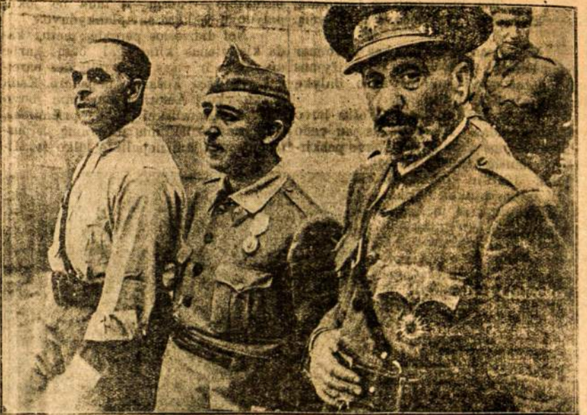
GENEROLAS FRANCO IR KITI VADAI. Jie vadovauja Ispanijos sukilėliams.

Pradžią graži — 100 litų kasoje! Kauno kiemsargiai iš šio susirinkimo įsitikino, kad jų viltys yra krikšč. darbinukuose, nes šie, pradėję rūpintis jų reikalais, tikrai jų neapvils.