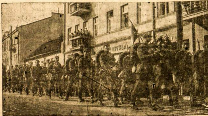
Saunosios Lietuvos Kariuomenės gretos.