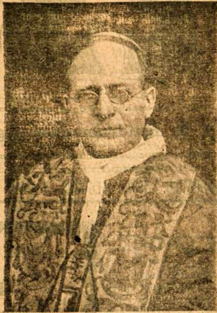
Popiežius Pijus XI

dinolai, ypatingai italai ir prancūzai, jau buvo linkę nusileisti visagalinciam žemes valdovui.