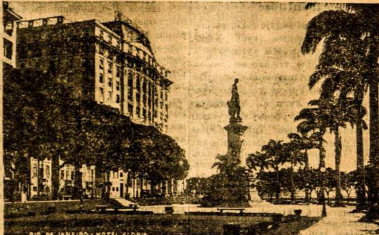
RIO DE JANEIRO MIESTO VAIZDAS.

Interiere, kožnoj fazendoj, Visur lietuvių «Sviesa» atrandal