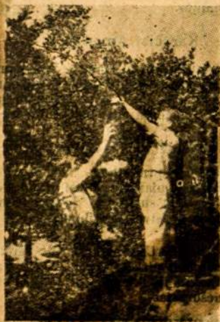
Obtūmāi ir lami... KIBULIAUJAM! Tokiu būdu lietuviško sodo apelsinai...

— Vyriausybiniukai tuo pačiu laiku skelbia, kad jie numuė sukilėlių 14 lėktuvų, kurie buvo atlėkę bombarduoti Madrido. Prie Madrido eina labai smarkus mušiai.