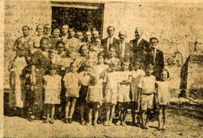
JIE MELDĖSI... CAXIAS LIETUVIAI PO PAMALDU PRIE SENIAUSIOS BRAZILIJOS BAZNYCIOS.