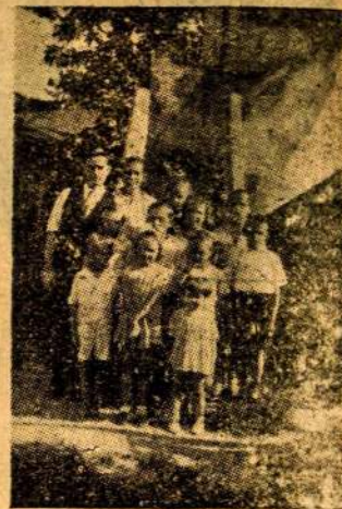
Lietuviais esame mes gimę... Jie laukia Rio lietuviškos mokyklos

P. Ziezius pirmą pradžiai bent trumpai painformuoja mane apie Rio lietuvius. Čia jų gyvenama apie 1000. Tačiau jie išsimėtę po visą didžiulį miestą ir priemiesčius. Sunku žinoti, kur kas gyvena. Mat, Rio lietuvių mažiau turi įsigiję nekilnojamos nuosavybės, negu sanpauliškiai. Gyvena