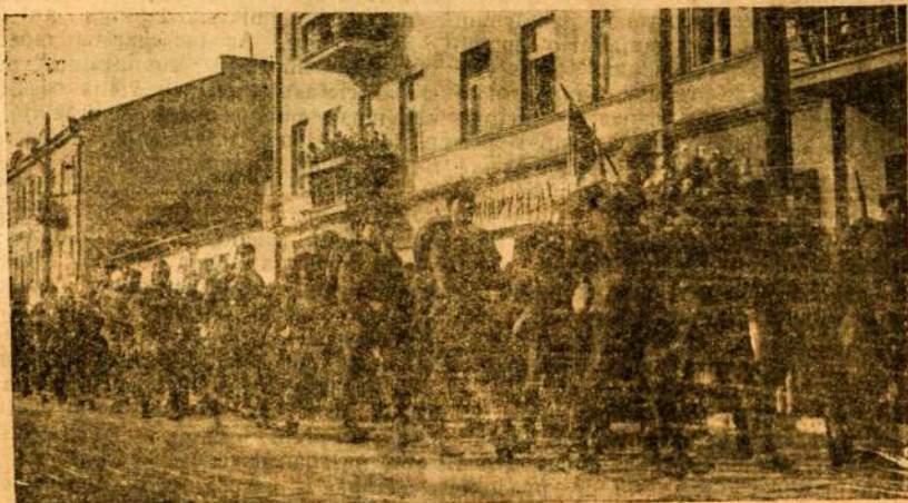
LIETUVOS KARIUOMENĖS PESTININKU PARADAS KAUNE.