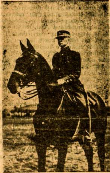
GENEROLAS ŽUKAUSKAS ant žirgo karinės tarnybos metu.

Amerikos lietuviai 1926 m. padovanojo jam aukso kardą. Jis, šią brangią dovaną laikydamas ne vien sau, bet ir visai Lietuvos kariuomenei, padovanojo mūsų Karo Muziejui.