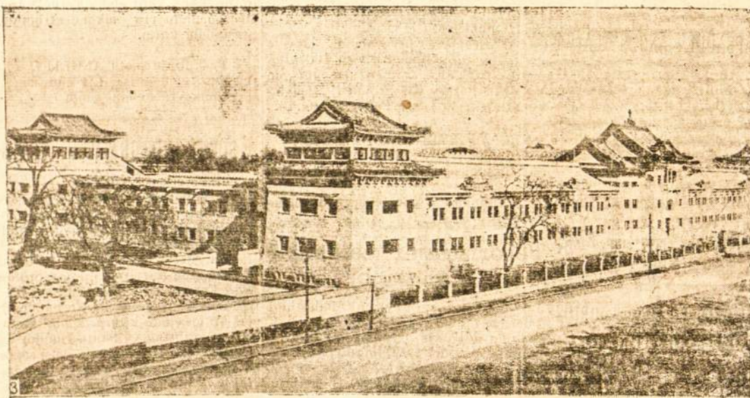
Šanchajaus „Aušros“ universiteto vaizdas.

Iš čia paskelbto konsulo rašto lietuviškoji kolonija mato ir, tikimės, supranta, kas konsului daugiau rūpi: ar pasišventėlių darbas, kurie dirba lietuvišką darbą be jokio atlyginimo, ar tie, kurie už menkiausį darbėl ima pinigų. Bet apie tai organizacijos atsakys kitą karta.