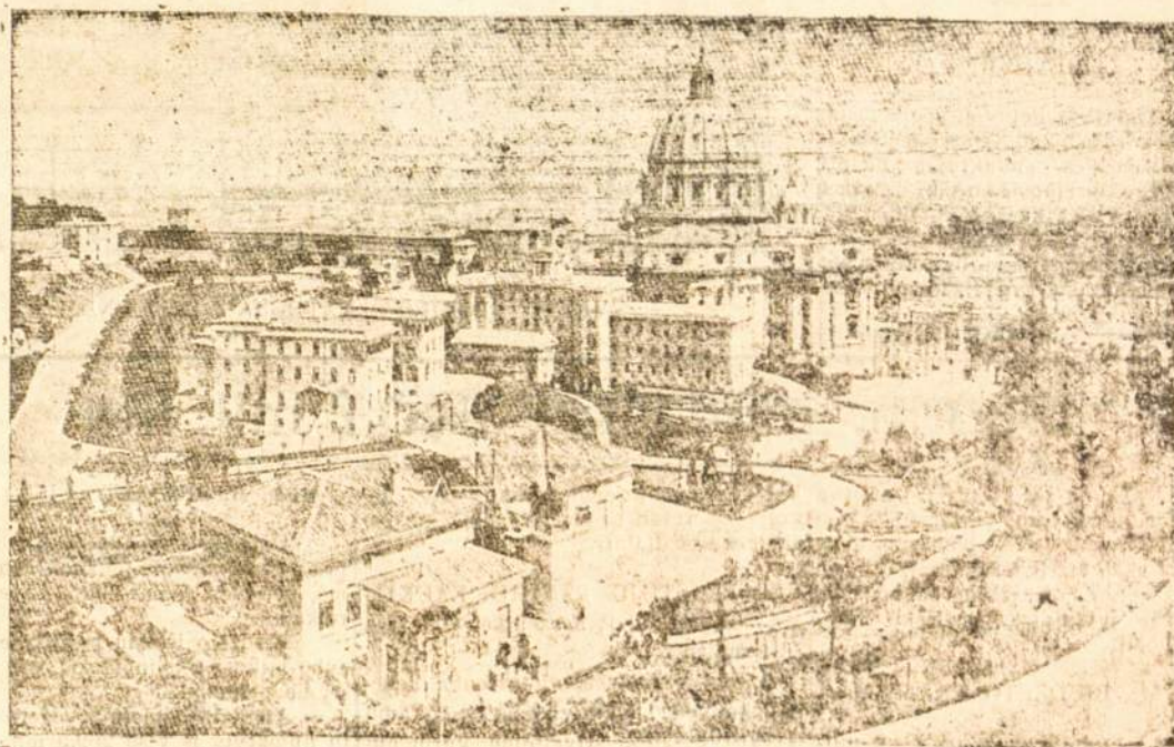
VATIKANAS. Matyti Šv. Petro Bazilika.