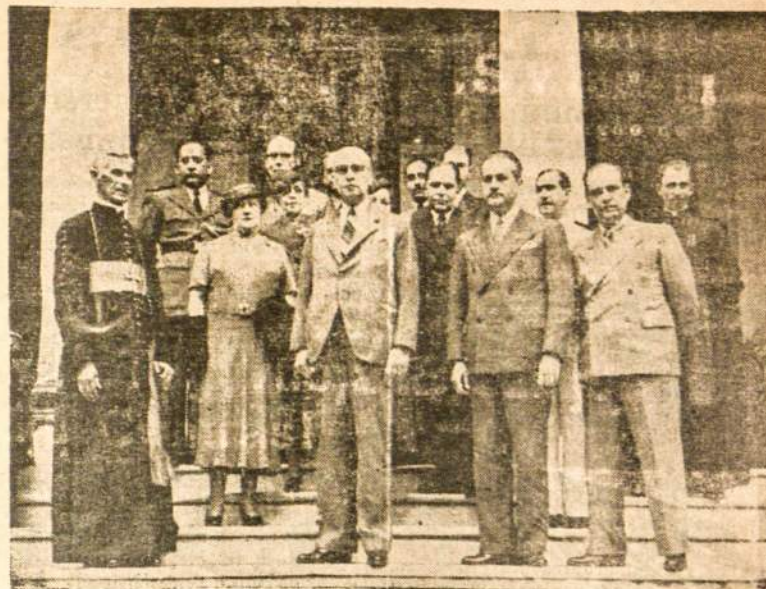
Paulistų valdžios vizitas São Paulo Arkivyskupui.