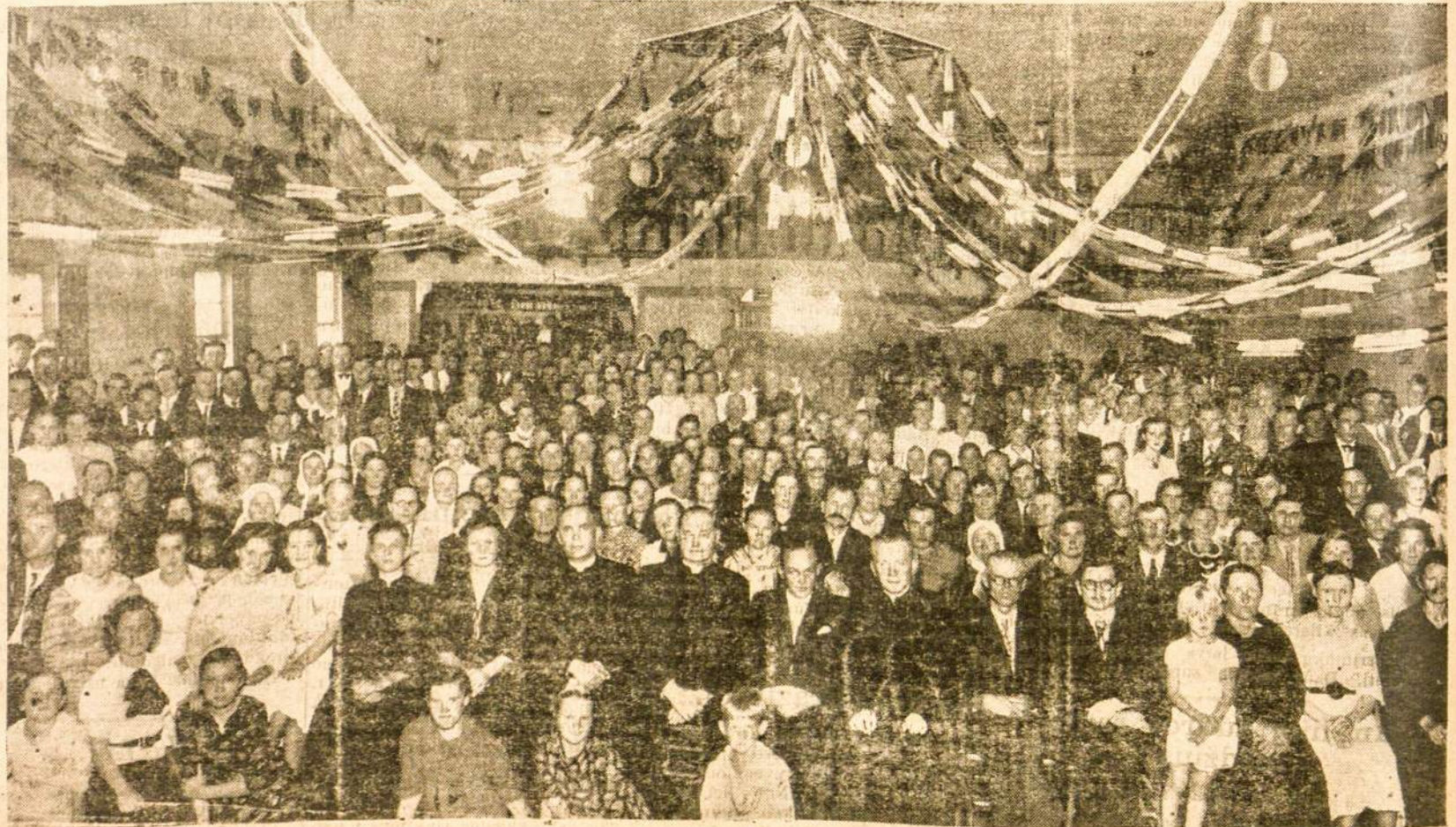
L. K. BENDRUOMENĖS SUSIRINKIMO DALYVIAI VAŠARIO M. 6 D. PIRMOSE EILESE SEDI IR SVEČIAI AMERIKIEČIAI.