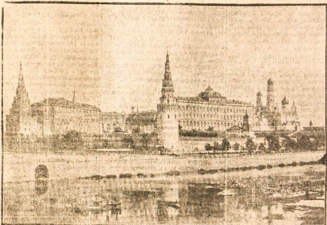
KREMLIUS, KURIAME GYVENO RUSU CARAI, O DABAR STALINAS.

Niekas nepatikės, kad toki komu- nistai, kaip Rykovas ir Krestinskis, jau 1921 metais būtų susidėję su „ka- pitalistais“ į sąjungą. Tačiau visi kal- tinamieji kaltę nuolankiai prisiėmė ir valstybės gynėjo žodžius patvirtino. Spandos ir diplomatinio korpuso atsto- vai nežinojo, kas apie tai ir galvoti. Tačiau atsitiko po to dalykas, kurio ligšiol nebuvo buvę Sovietų teismų praktikoje.