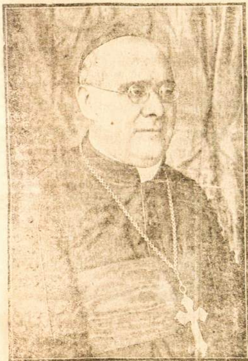
Brazilijos Kardinolas D. Sebastião Leme.

Havaso telegramų agentūra praneša, kad lenkų valdžios organai Vilniuje suėmė 12 lietuvių, kuriuos apkaltino valstybės išdavimu ir špionazu. Visi pasodinti į kalėjimą.