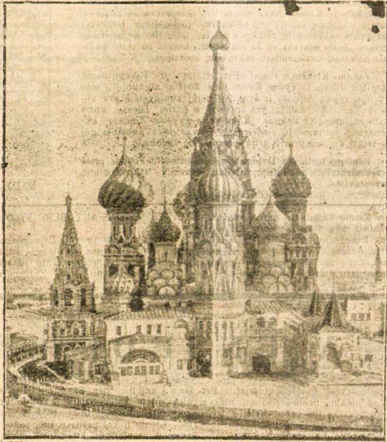
Viena iš gražiausių bažnyčių, visoje Sovietų Rusijoje, tai yra šv. Bazilio, kuri randasi Maskvoje.