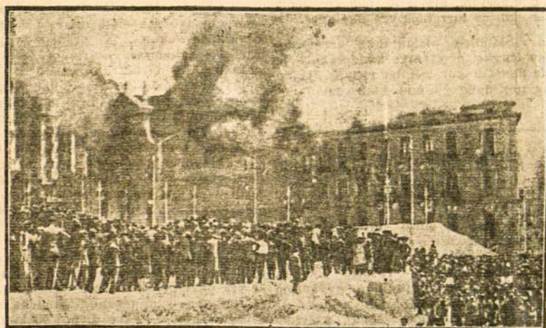
VYRIAUSYBININKU UŽDEGTAS JEZUITŲ VIENUOLYNAS MADRIDE.

Gegužės mėn. 13 dieną 14 val. 31 minutę nusileido Nalale keturių motorų vokiečių Lufthanzos lėktuvas „Nordwind“, kuris rekordiniu laiku perskrido Atlantą — 11 valandų ir 11 minučių. Vadinasi, jau nereikia nė pusės paros kad iš Europos žemyno atsikurtų žmogus Naujame Pasaulyje.