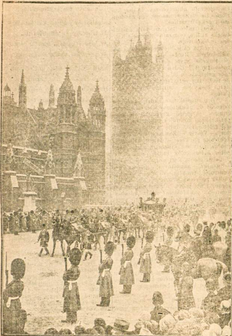
ANGLU KARALIUS VYKSTA ATIDARYTI PARLAMENTO.

— RUSIJŲ jau kuris laikas veikia slapta trumpų bangų radio stotis. Ji yra pavergtosios tautos balsas pasauliui. Savo pranešimus pradeda džiūlais: «Staline! Tavo dienos suskaičytos. Visos tavo niekybės greit nukris ant tavo paties galvos!» GPU deda visas pastangas stotį surasti, bet nieko nepasiekė. Tiek nustatytą, kad stotis įrengta netoli Baltijos valstybių. Tarp kitko, pranešė esant didelę slaptą organizaciją, kurios tikslas — nužudyti Staliną. «Mes nebūsimė išdavikai! Staline! Tavo dienos suskaičytos!» — baigia savo pranešimus paslaptingas siųstuvąs.