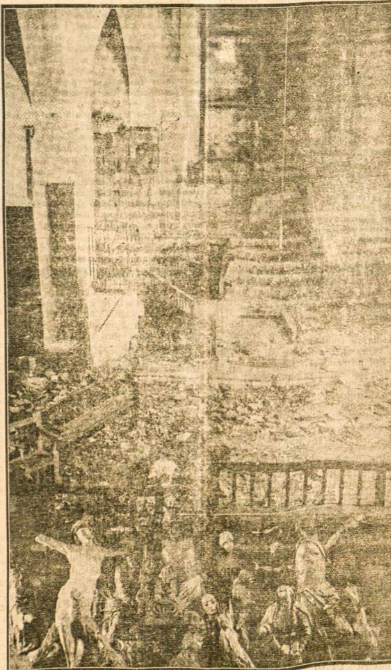
ISPANIJA. Vyriausybinių sunaikintos bažnyčios griuvėsiai.

Pietvakarinėje Prancūzijos dalyje, Languedoc provincijoje, valdžios lėšomis buvo padaryta keletas gręžimų stekiančių iki 3000 metrų. Gręžimai būvę padaryti su tikslu rasti tose vietose žibalo šaltinius. Iki šiol Prancūzijoje žibalo buvo randama tik rytinėje dalyje, Elzase. Rastas žibalas būtų naudojamas karo reikalams.