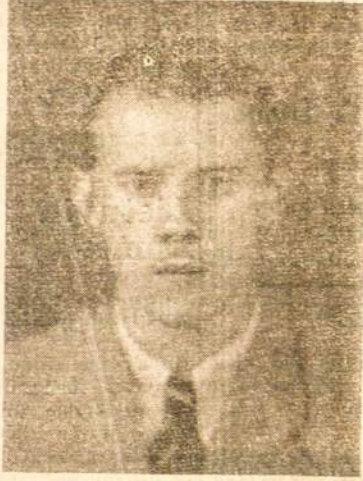
L. R-K. Bendruomenės Choristams