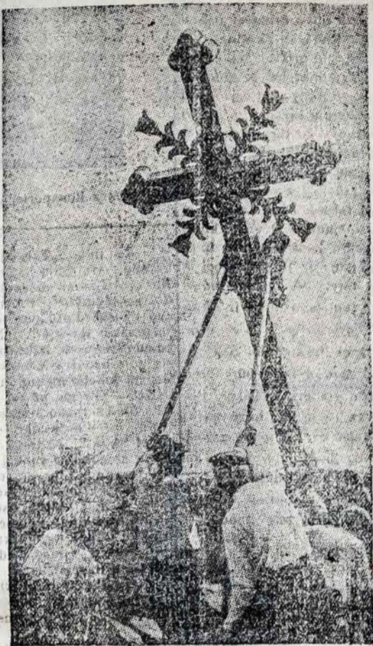
Lietuviai dar iškels rusų išvartytus Kryžius!

Kaunas. Okupantai Lietuvoje vartoja lygiai tuos pačius metodus, kuriuos vartojo ir tebevartoja Rusijoje ir kurių pagalba šis teroro režimas laiko si. GPU agentai tuo pačiu smarkumu slaudžia Lietuvoje, kaip ir pirmomis pavergimo dienomis, suimti daugiameikius jiems netinkantį ar kokį žodį prasiitarusį prieš rusus asmenį. Iš kitos pusės, komunistai vartoja ir nublukusią savo kaocapiškos vyžos propagandą, rodydami rusiškas filmas, kuriose Rusijos gyvenimas tikrai vaizduojamas rožumi. Lietuviai, žinodami, koks «rojus» yra Lietuvoje, tik nusispiauja ir rusiška propaganda netiki.