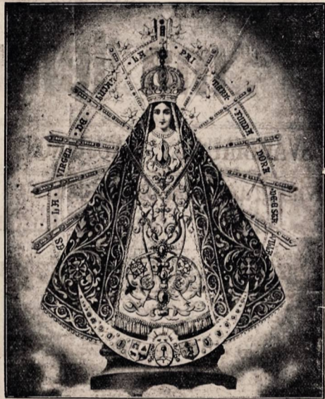
Stebuklingasai ŠS. Panelės paveikslas Lujane, kurį aplankys ši sekmadienį lietuviai.

Del to paties dalyko, bet jau ne be juokais, pranešė Tautų Sąjungai, kad ši atsimitų savo pažadus ir suteiktų Etiopijai pagalbą.