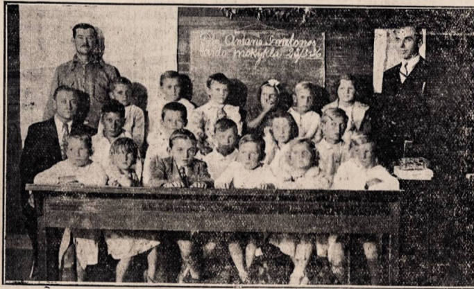
Prez. A. Smetonos vardo mokykloje mokslas pradėtas su sekanciais vaikais.