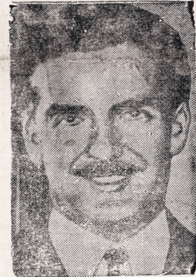
KAP. EDENAS, kuris tarėsi su Lenkijos užs. reikalų min. Beku