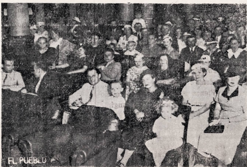
Dalis svečių dalyvavusių LA RAZON pilietiniame paminėjime

KAD BULVĖS išvirtos nepasileistų, reikia prieš verdant (nuskustas) palaikyti šaltan vandeny.