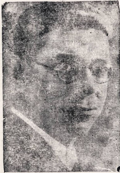
GENEROLAS MOLA, kuris vadovauja Madrido apsupime

ti. Tuo reikalu Italijos atstovas Paryžiuje įteikė notą. Italų spauda pradėjo pulti prancūzus.