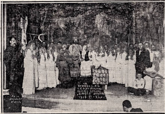
Mindaugo vaidintojai suvaidynė operete Birutė