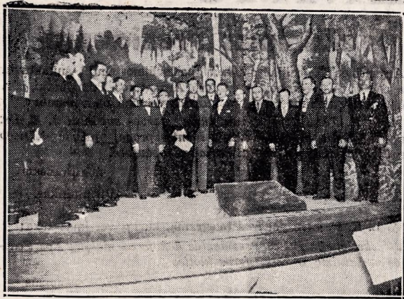
„Mindaugo“ draugijos vyrų choras