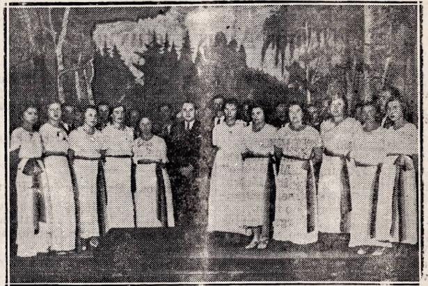
„Mindaugo“ draugijos Moterų choras.