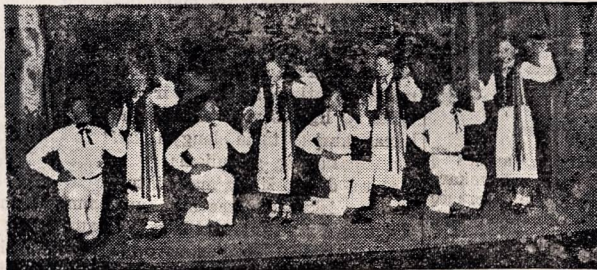
„Mindaugo“ draugijos čiagimiai artistai šoka lietuvišką suktinį

El día 23 de Julio de 1938, sábado, a las 21 horas, La Sociedad Litwana "Mindaugas" conmemorando su séptimo año de vida, realizará una FUNCIÓN TEATRAL Y CONCIERTO en el que tomarán parte el cuadro de artistas, el coro y solistas de la sociedad.