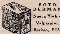
Nueva York y Valparaiso, Berisso, FCS.

Daro specialias fotografijas skerdyklių karnetas