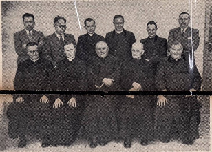
Svečiuose pas Tėvus Marijonus.