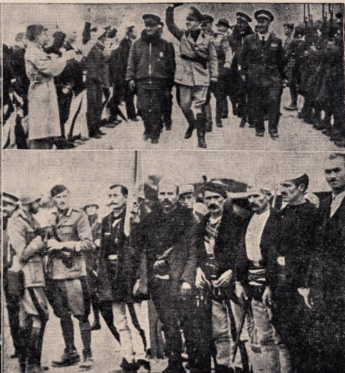
Vaidzas Albanijos, kurią neperseniausiai okupavo italai. Viršuj, dešinėje, Ciano įeina į Tirana. Apačioje, Albanijos gynėjai varomi į koncentracijos stovyklą.