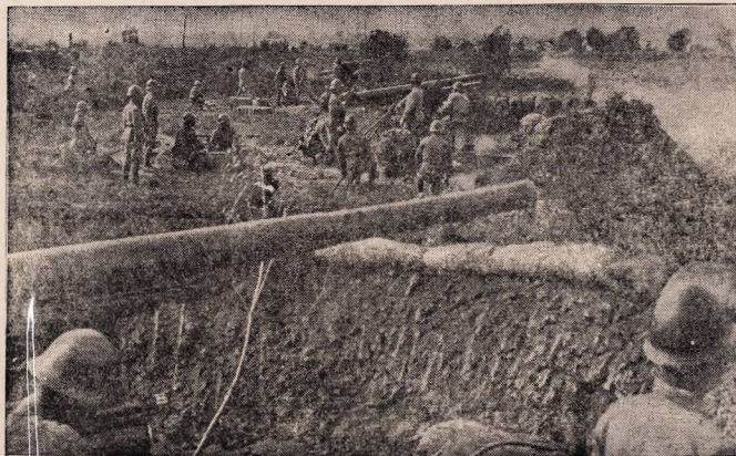
Kinijos užpuolikai sustatė baterijas ties Che - So upe.

Po didelių pastangų tapo galutinai susitarta su kino savininku, kuris rugsėjo 2 dienai užleido Berisso kino — teatrą „Progreso“, lietuviškų filmų parodomui. Šiuo kartu bus parodyta nemažai ir labai gražių lietuviškų filmų. Tad ne vienas galėsime išvysti gražiausių savo krašto ir tėvynės vaizdų, įvairių kariuomenės ir visuomenės iškilnių, švenčių. Žodžiu, nuo brolelio artojėlio, sesutės šienpiovėles, iki ministerių, karo vadų ir prezidento. Taip pat pamatysime ir paskutiniųjų, šių metų įvykių; vietomis filmos bus garsinės. Kadangi filmos bus rodomos tik kartą, tad pasistenkime visi jas pamatyti. Plati programa bus išleista atskirais lapeliais; kuriuos galima gauti kino kasoje, p. Bogužo restorane ir kitur. J.